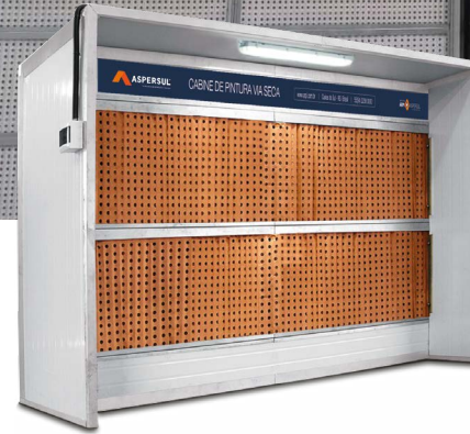
CABINES VIA SECA