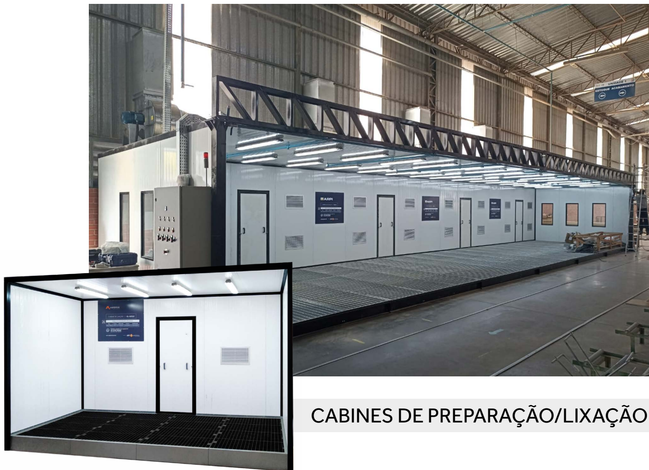
CABINES DE PREPARAÇÃO/LIXAÇÃO