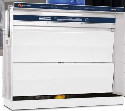
CABINES VIA ÚMIDA