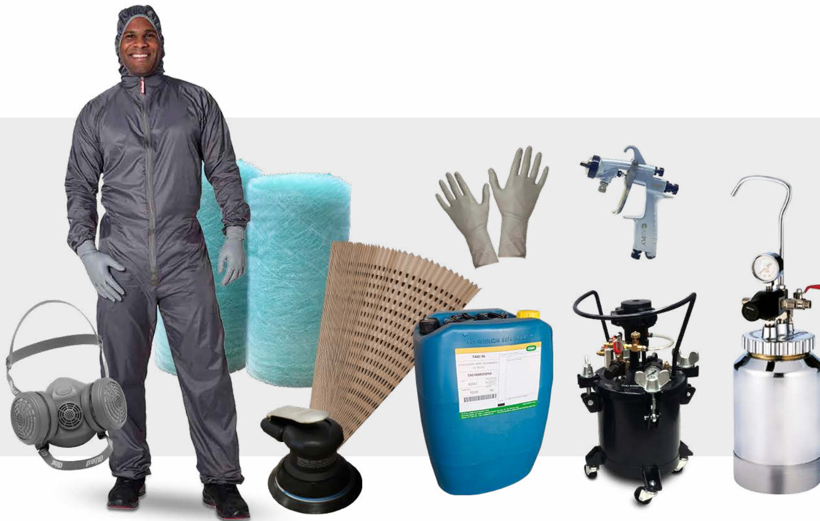
EPIS, FILTROS E ACESSÓRIOS PARA PINTURA